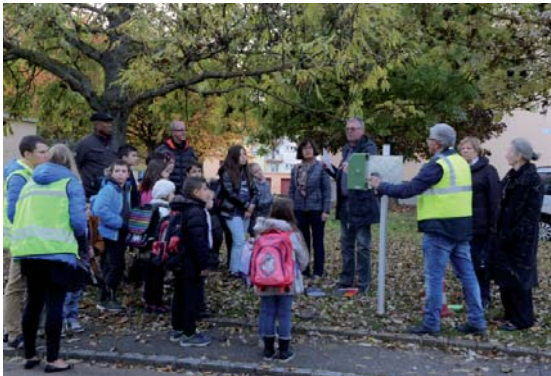
Distributeur de canisacs installé par le C.M.J.

VOTRE CHIEN FAIT SES BESOINS... RAMASSER ? C'EST BIEN METTRE A LA POUBELLE, C'EST NICKEL !