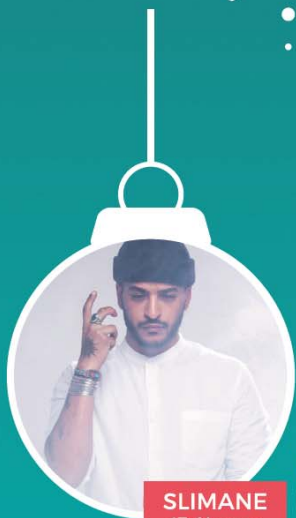
SLIMANE 17 février