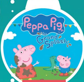
PEPPA PIG 18 mars