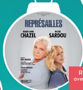
REPRÉSAILLES avec Michel SARDOU 25 janvier