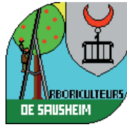
Arboriculteurs de Sausheim