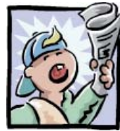
Conseil municipal des jeunes