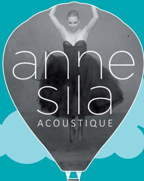
DESTINATION ANNE SILA Mercredi 5 Avril