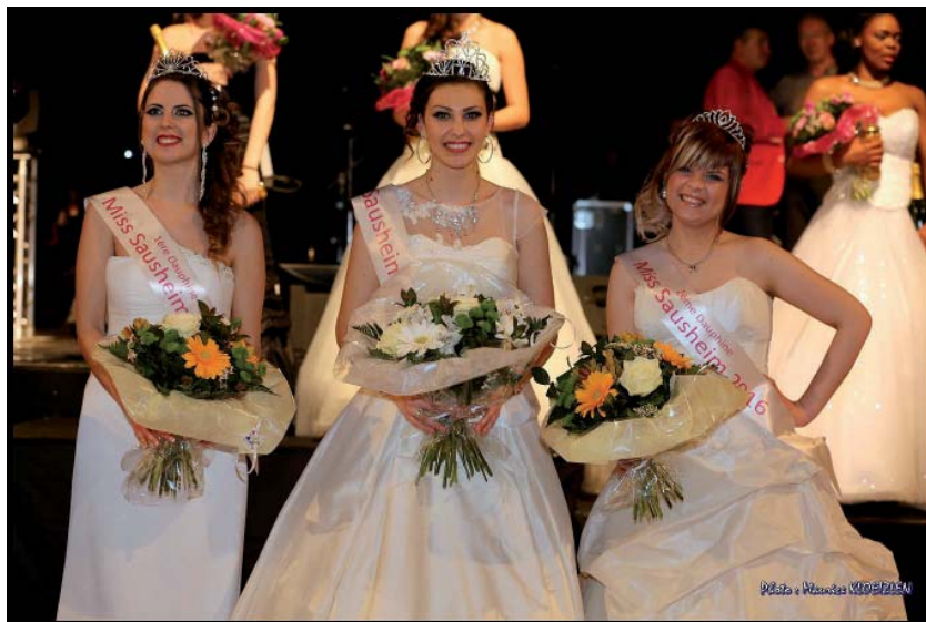
Miss SAUSHEIM 2016 et ses dauphines

Renseignements et inscription au Service Culturel - 6C rue de l'Île Napoléon, Tél. : 03.89.56.09.90.