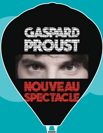
DESTINATION GASPARD PROUST Vendredi 3 mars