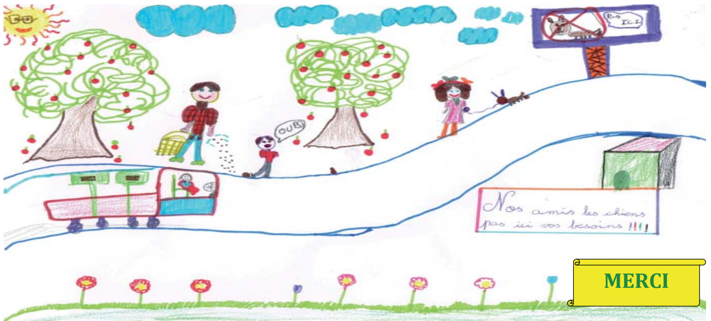
Action de sensibilisation à la propreté dans notre village