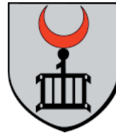
Commune de Sausheim