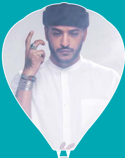
DESTINATION SLIMANE Vendredi 17 février