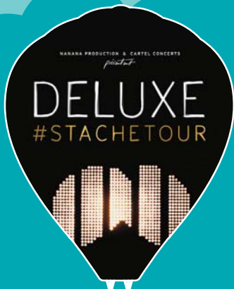
DESTINATION DELUXE Samedi 25 février