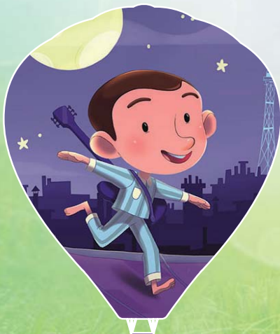
DESTINATION ENFANTILLAGES 3 1 er avril 2018 | 14h30 et 18h30