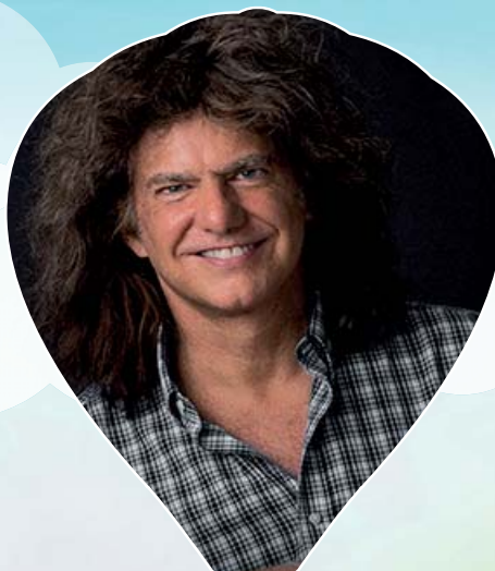
DESTINATION PAT METHENY 15 octobre 2017 | 20h