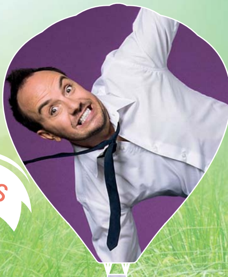
DESTINATION JARRY 20 janvier 2018 | 20h