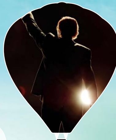
DESTINATION MICHEL LEEB 22 février 2018 | 20h