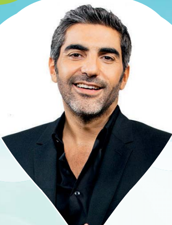
DESTINATION ARY ABITTAN 12 mai 2017 | 20h