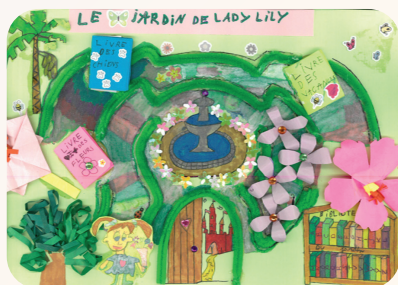
1 er prix enfant

Un grand bravo à tous les artistes qui ont tous débordé d'imagination.