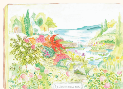
1 er prix adulte